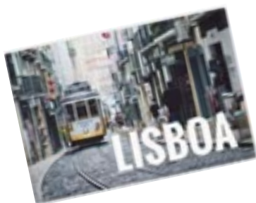
Magnet rigide 7.6 cm x 5.1