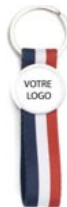
Porte-clés tissu personnalisable 35 x